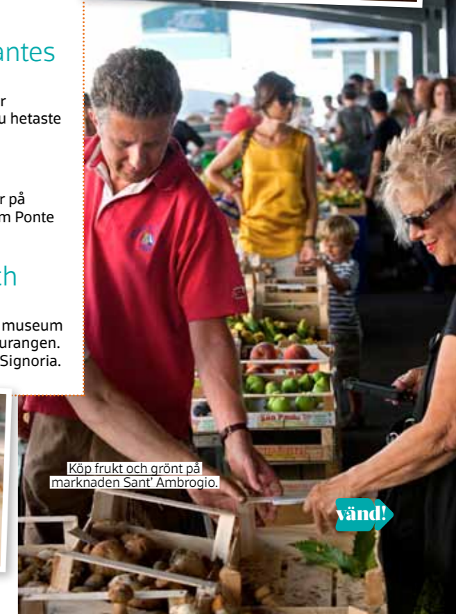
Köp frukt och grönt på marknaden Sant' Ambrogio.