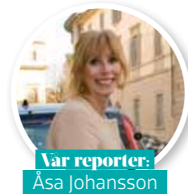
Var reporter: Åsa Johansson

TEXT: ÅSA JOHANSSON ILLUSTRATION: TOVE DREIMAN